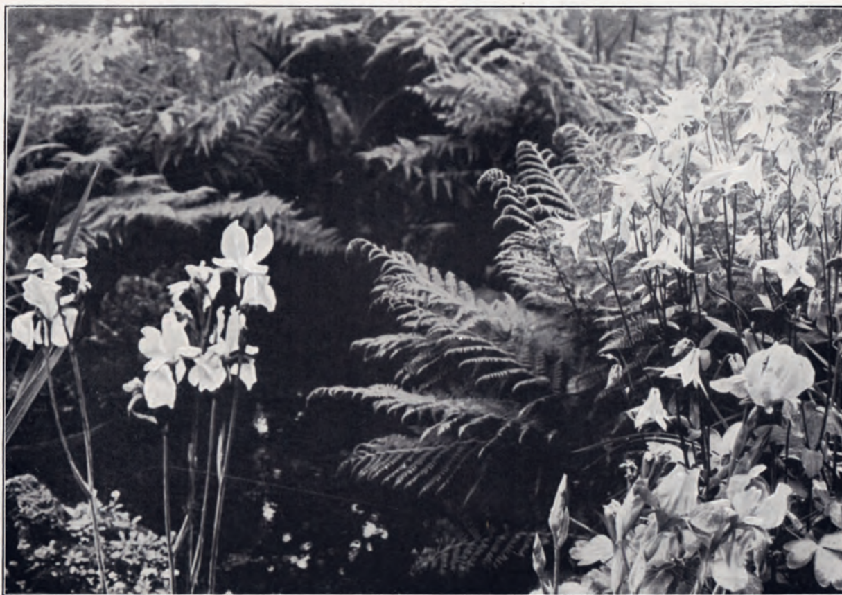
Abb. 76. Sibirische Schwertlilie und weiße Akelei am Teichufer.

zuvor durch den deutschen Botaniker Hermann Berge oder den irischen Gartenschriftsteller William Robinson publiziert worden waren. Lange unterschied zwischen dem Charakter des Standorts und der Physiognomie der Einzelpflanze. Den Begriff «Charakter» verstand Lange als kulturelles Leitmotiv, das im «Naturgarten» durch die Landschaft definiert werde. Im Charakter einer Landschaft würden gleichzeitig die biologischen und pflanzensoziologischen Gesetzmässigkeiten der Pflanzenwelt sichtbar: «Die Landschaft erhält durch die Pflanzengesellschaften ihren <Charakter>, die Pflanzengesellschaften zeichnen die Züge im Antlitz der Landschaft.» 10 Unter dem Begriff der Physiognomie jedoch verstand Lange die spezifische Anpassung einer Pflanze an einen Standort,