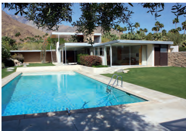
Abb. 6: Garten und Haus Kaufmann heute: Während das Haus unlängst vorbildhaft renoviert wurde, hat der Garten am Pool viel von seiner einstigen Pflanzenvielfalt verloren.