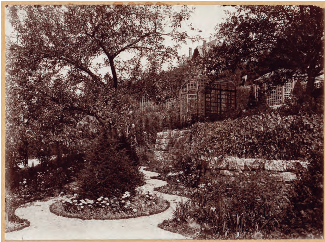
Abb.1: Überquellende Staudenpflanzungen: Der Garten Schweickhardt in Zürich, 1919.