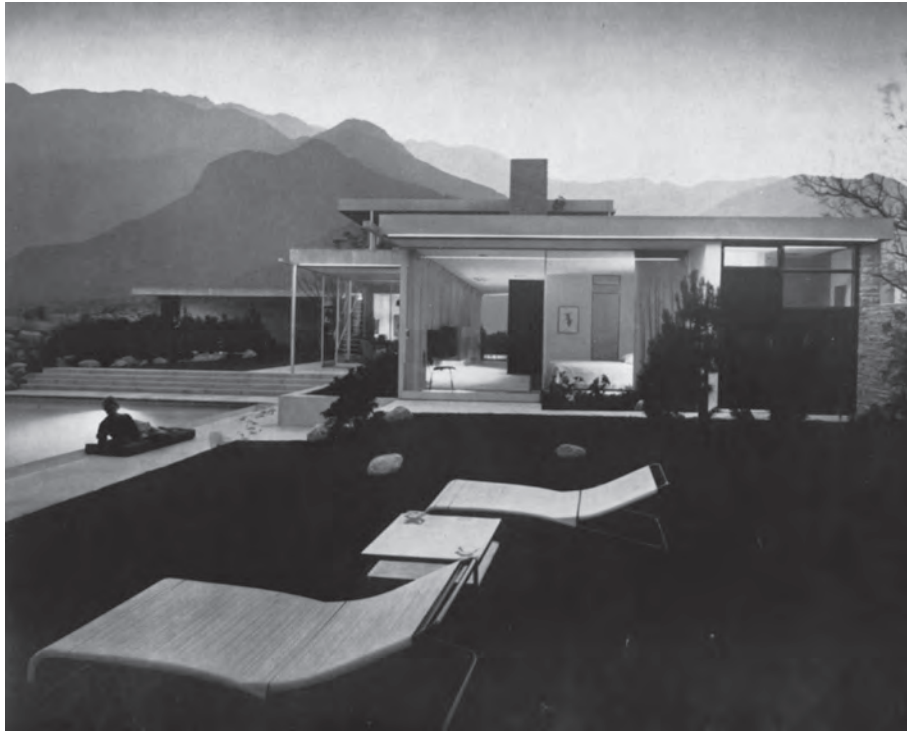
Abb. 4: Stilisierter Ort «biorealistischen» Lebens: Haus Kaufmann und Garten, 1946.

Das neue Haus in der kalifornischen Wüste bei Palm Springs am Fusse des Mount San Jacinto diente dem Paar als Urlaubsdomizil im Winter. Das Bungalow öffnete sich über grosszügige, bewegbare Glastüren und Fensterfronten hin zum Garten. Hier, auf der windabgewandten Seite lag der Swimmingpool, eingebettet in grosszügige Rasenflächen und lockere Strauchpflanzungen. Eine Fotografie des Anwesens von Julius Shulman, die buchstäblich um die Welt ging, hatte Neutras Vision eines biorealistischen Lebens bildlich eingefangen (Abb. 4). Der entspannte Aufenthalt in Haus und Garten versprach die physische Stärkung ihrer Bewohner, und das magische Zwielflicht schien dem Betrachter die spirituelle Dimension der Natur nahelegen zu wollen – einer Natur, die mithilfe der Technik zugänglich und komfortabel wurde.