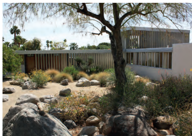
Abb. 7: Das Haus Kaufmann auf der Bergseite: Neutras Idee «schillernder Akzente» in der Wüstenlandschaft ist heute noch ablesbar.

Rasen schien jedoch nicht nur ein Stück weit amerikanische Normalität mitten in der Wüste zu versprechen. Er trug auch zu einem gemässigten Mikroklima bei, das mithilfe eines ungeheuren Wassereinsatzes aufrechterhalten wurde. Die Natur des Gartens umfasste damit nicht nur eine ästhetische Komponente. Sie war auch funktional.