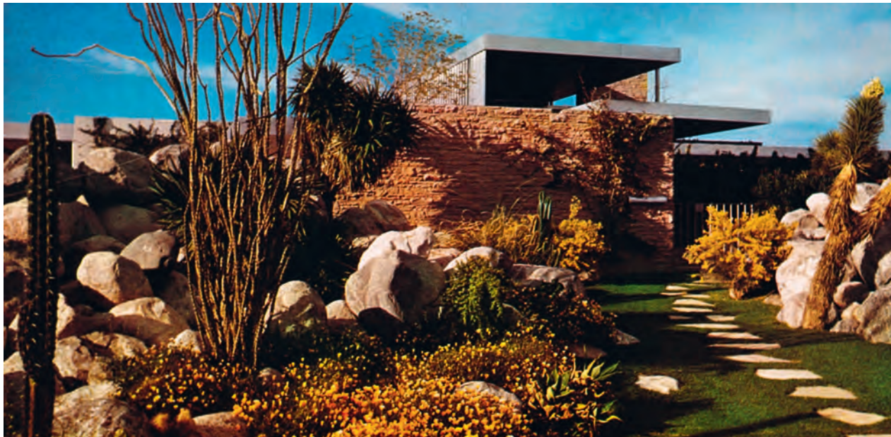
Abb. 5: Opulente Wüstenvegetation: Eingangsbereich des Haus Kaufmann im Frühjahr 1947.

Auch im Eingangsbereich bereicherte Neutra Aspekte der Wüstenvegetation mit attraktiven Exoten (Abb. 5). Neben Yucca und Pachycereus Kakteen blühten hier Bougainvillea und gelbe Lantana . Die Struktur der Pflanzung bildeten Arten mit ausgesprochen skulpturalen Qualitäten. Verwendete Neutra in anderen Projekten gerne grosslaubige Arten wie Philodendron oder Bananenstauden, waren es hier die bizarren Wüstengestalten wie der Ocatillo mit seinen langen, nach oben strebenden, stacheligen Ästen. Ein wichtiges Gestaltungsmittel des Gartens waren auch die Felsen. Sie trugen ein Charakteristikum der Wüste in den Garten hinein, das gleichzeitig bewusst stilisiert wurde. Insbesondere die spannungsvollen Einzelsetzungen der Steine, aber auch die Trittplatten des Eingangs erinnerten an japanische Vorbilder, wie sie Neutra seit seiner Reise nach Japan im Jahre 1930 aus eigener Anschauung kannte.